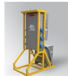
Distribuidores de Energía

MELTRIC creando ambientes seguros de trabajo.